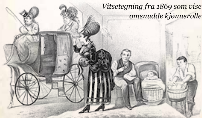
Vitsetegning fra 1869 som viser omsnudde kjønnsroller

☞ Liberalismen og kravet om flere demokratiske rettigheter fører til bedre kår for kvinnene. Arveloven av 1854 gav døtre samme arverett som sønner. Ugifte kvinner fikk status som myndige i 1864, mens gifte kvinner ikke fikk denne statusen før i 1888. De fikk da rett til å disponere over egen formue. Disse ytre endringene skjer samtidig som Camilla Collett setter fokus på en indre emansipatorisk (frigjørende) side ved det å være kvinne i et mannssamfunn.