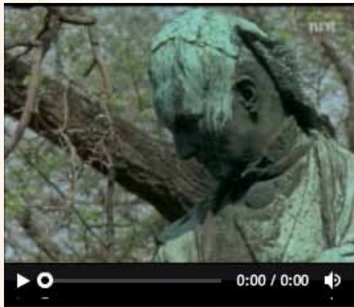
Kvinner sakskvinnene i 1970-årene førte arven etter Camilla Collett videre

☞ I 1877 publiserer Camilla Collett Kvinden i Litteraturen , en stor utredning om emnet. Her studerer hun kvinnene i bøker av mannlige forfattere, og hun ser på dikterens holdninger. Hun stiller spørsmål ved hvor langt frigjøringen egentlig er kommet. Collett står her fram som en tidlig litteraturanalytiker og kritiker.